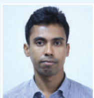
tgvt tmvtnj ivbv cfvl K