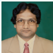
ಕೆಡಿಮಿ ತಗ್ವೆ ತಿವ್ವರಿಬ್ ಆವ್ಜಿ ಎಕ್ಸ್.ಐ.ಐ.ಎ.ಐ.ಎ.ಐ.