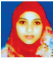
dvi`v Bqıvıgvıv cfıvı K