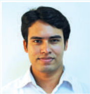
tgt ivK` j Bmj vg cfvl K