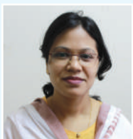
Dtaf mvgv gy cfvl K