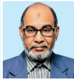
ငြိမ်းချမ်းရေး အဖွဲ့ အဖွဲ့