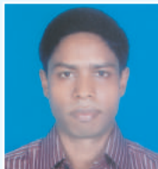
នាយករដ្ឋមន្ត្រី នាយករដ្ឋមន្ត្រី