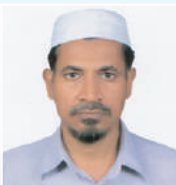
ငြိမ်းချမ်းရေး အဖွဲ့ဝင် အဖွဲ့ဝင်