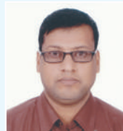
នាយករដ្ឋមន្ត្រី នាយករដ្ឋមន្ត្រី