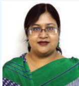
mjvBqv LvZb mnKvix Aa'cK