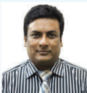
នាយករដ្ឋមន្ត្រី នាយករដ្ឋមន្ត្រី