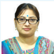
ಬಿವಿಜಿ ತಗ್ವೆ ಬಿ ಮೆಠಿಎಕ್ಸ್ ಆರ್.ಎಕ್ಸ್.ಐ.