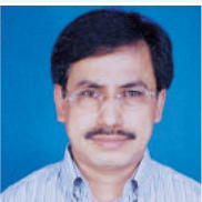
ಮಿವಿ ಕಿ ತಗ್ವೆ ತಿವ್ವಿ ಮೆಠಿಎಕ್ಸ್ ಆರ್.ಎಕ್ಸ್.ಐ.ಐ.ಪಿ.ಎ.ಐ.