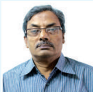
ತಗ್ವೆ ಮುನುಬ್ಜಿ ಆವ್ಜಿ ಮೆಠಿಎಕ್ಸ್ ಆರ್.ಎಕ್ಸ್.ಐ.