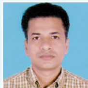
ಕಿವಿವಿ ಆವ್ಜಿ ಮೆಠಿಎಕ್ಸ್ ಆರ್.ಎಕ್ಸ್.ಐ.