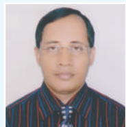
ငြိမ်းချမ်းရေး အဖွဲ့ဝင် အဖွဲ့ဝင်