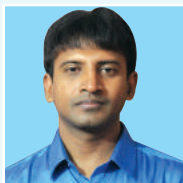
ಗಿ ತಗ್ವೆ ರಿವಿಜಿ ಬಿವ್ಜಿ ಮೆಠಿಎಕ್ಸ್ ಆರ್.ಎಕ್ಸ್.ಐ.