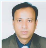
ငြိမ်းချမ်းရေး အဖွဲ့ဝင် အဖွဲ့ဝင်