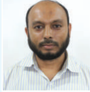
tgt Rwn`j Kiei cfvl K