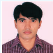
ತಿರಿವ್ಜಿ ಆವ್ಜಿ ಮೆಠಿಎಕ್ಸ್ ಆರ್.ಎಕ್ಸ್.ಐ.