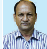
នាយករដ្ឋមន្ត្រី នាយករដ្ឋមន្ត្រី