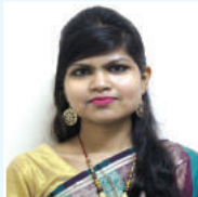
ಗಿವಿ ಬಿವಿ ಜಿವಿವಿ ಎ.ಎ.ಎ.ಎ.