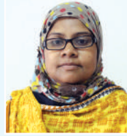
Zmıgvbıv bvn` cfıvı K