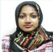
ಜಿವಿವಿ ಜಿವಿವಿ ಎ.ಎ.ಎ.ಎ.