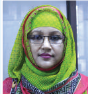
នាយករដ្ឋមន្ត្រី នាយករដ្ឋមន្ត្រី