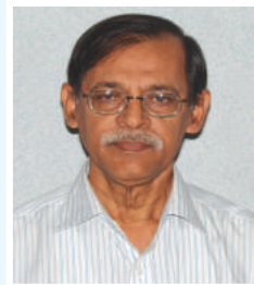
ငြိမ်းချမ်းရေး ကိုယ်စားပြု အဖွဲ့ဝင် (အဖွဲ့ဝင်)