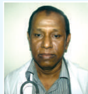
នាយករដ្ឋមន្ត្រី នាយករដ្ឋមន្ត្រី