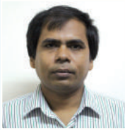
tgt Kvqmi Avj x cfvl K