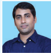
Abvc g veklm cfvl K