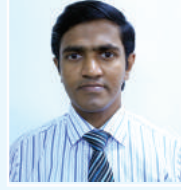
នាយករដ្ឋមន្ត្រី នាយករដ្ឋមន្ត្រី