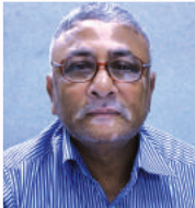
នាយករដ្ឋមន្ត្រី នាយករដ្ឋមន្ត្រី