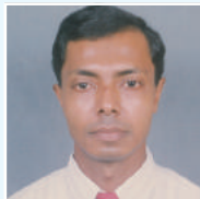
ತಗ್ವೆ ಗಿವಿವಿ ಬಿವಿವಿ ಮೆಠಿಎಕ್ಸ್ ಆರ್.ಎಕ್ಸ್.ಐ.