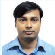
ತಿವಿವಿ ಎವ್ಜಿ ಎ.ಎ.ಎ.ಎ. (ಎ.ಎ.ಎ.ಎ.)