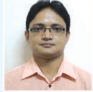
mgxi b` tcvl` vi cfvl K