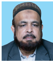
ငြိမ်းချမ်းရေး ကိုယ်စားပြု အဖွဲ့ဝင် (အဖွဲ့ဝင်)