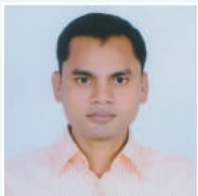
ತಗ್ವೆ ಗುಡಿ ಇಂಗುಬ್ ಮೆಠಿಎಕ್ಸ್ ಆರ್.ಎಕ್ಸ್.ಐ.