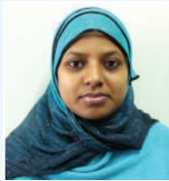
wkıvıvıv Av 3 vi cfıvı K