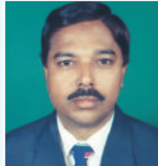
ငြိမ်းချမ်းရေး အဖွဲ့ဝင် အဖွဲ့ဝင်