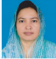
នាយករដ្ឋមន្ត្រី នាយករដ្ឋមន្ត្រី