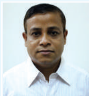
នាយករដ្ឋមន្ត្រី នាយករដ្ឋមន្ត្រី