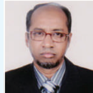
ငြိမ်းချမ်းရေး အဖွဲ့ဝင် အဖွဲ့ဝင်