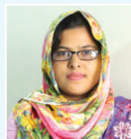
vmMgv ingvb cfvl K