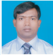
tgt ti RvDj Kni g kvl b cfvl K