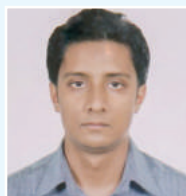
Zbq mi Kvi mnKrix Aa'icK