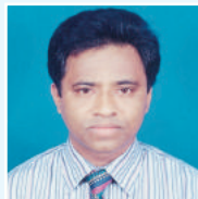
ಆವೆಬಿಎಸ್ ತಗ್ವೆ ತಿವ್ವರಿಬ್ ಜಿ ಮೆಠಿಎಕ್ಸ್ ಆರ್.ಎಕ್ಸ್.ಐ.