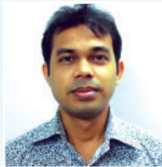
tgt Avtbaqi tntmb cfvl K