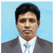
ತಗ್ವೆ ನುಮಬ್ಜಿ ಐ ಕೆ ಮೆಠಿಎಕ್ಸ್ ಆರ್.ಎಕ್ಸ್.ಐ.