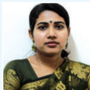
ಗಿವಿ ಇ ಎ.ಎ.ಎ.ಎ.