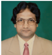
ငြိမ်းချမ်းရေး ကိုယ်စားပြု အဖွဲ့ဝင်