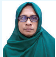
នាយករដ្ឋមន្ត្រី នាយករដ្ឋមន្ត្រី