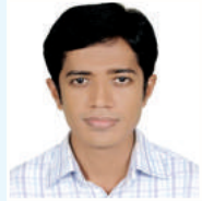
tgt Zvi Ki ingvb cfvl K