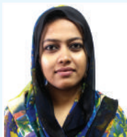
kwn`v kvigyb cfvI K