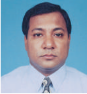
ឧបនាយករដ្ឋមន្ត្រី ក្រុមប្រឹក្សា