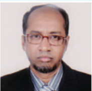
ಕೆಡಿಮಿ ತಗ್ವೆ ಆವ್ಜಿ ಕಿವಿವಿ ಎಕ್ಸ್.ಐ.ಐ.ಎ.ಐ.ಎ.ಐ.