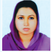
mıwıvıv Avdmi x cfıvı K