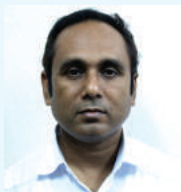
នាយករដ្ឋមន្ត្រី ក្រុមប្រឹក្សា