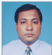
ឧបនាយករដ្ឋមន្ត្រី ក្រុមប្រឹក្សា