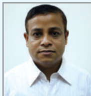
នាយករដ្ឋមន្ត្រី ក្រុមប្រឹក្សា