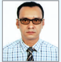
বি ত্গৰম্ব$ উক্চ ম্নক্ৰিখ আ'ত্ক