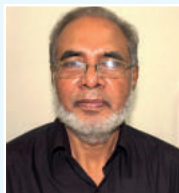
នាយករដ្ឋមន្ត្រី ក្រុមប្រឹក្សា