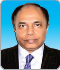
4. Rbve G Gd Gg mi l qvi Kvgj