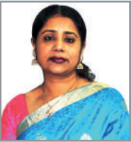
কৱ্গি`ব ৰনৱি ম্নত্হম্খ আ'ত্ক