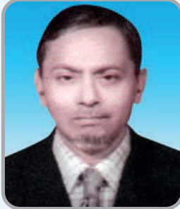
2. cldmi W. tgv nwee Dj,vn