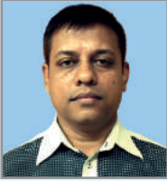
তগ্ৰত ৰুৱিঝি অজ্গ তকল ম্নত্হম্খ আ'ত্ক ল ত্পৱিগ'ব