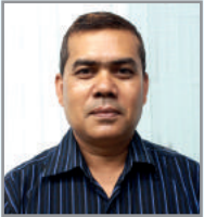
গম্ব$ ৱবৰ্গ ডি'খ ম্নত্হম্খ আ'ত্ক