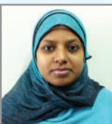
kwib Av`vi cfil K