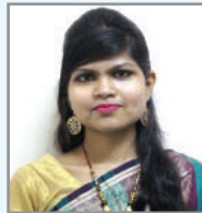
Gvi b mj Zv`bv चिचि K