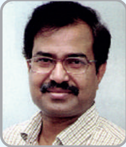
10. Rbve gvndRj nK kvnxb