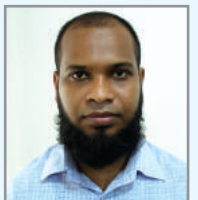
তগ্ৰত মত্ৰ` তন্ত্ৰম্ৰ চ'ফিলক