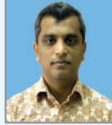
kbiRZ mrv mnthMx Aa`cK