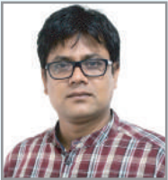
ত্গৰম্ব$ অৱে`জ্ন ম্য় ৱ্গ ম্নক্ৰিখ আ'ত্ক