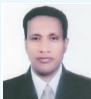
នាយករដ្ឋមន្ត្រី ក្រុមប្រឹក្សា