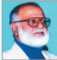
ငါးမိ ကုာ် တွဲ ဝိာ် ဝိာ် ဝိာ် အာ်မိ ငါးမိ