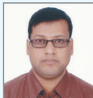
នាយករដ្ឋមន្ត្រី ក្រុមប្រឹក្សា