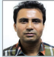
cv`e/vb मन्थमि आ`िक्क