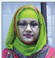
នាយករដ្ឋមន្ត្រី ក្រុមប្រឹក្សា