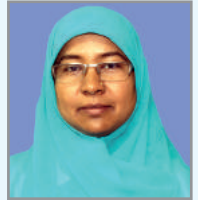
গম্ব্জ ৱ লৱ্গ ম্নত্হম্খ আ'ত্ক