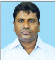
অৱেইকি মমি`ক ম্নক্ৰিখ আ'ত্ক