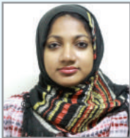
Zmvgbv Zv`ni चिचि K