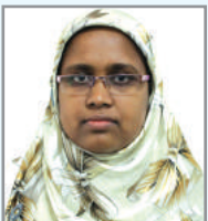
ম্জ গৱ অৱি চ'ফিলক