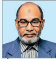
ငါးမိ တွဲ အွေမိ အာ်