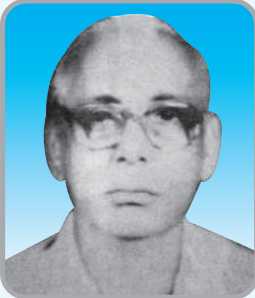
7. Aa`vcK tgv Avej ekvi