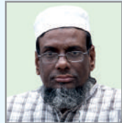
ငါးမိ တွဲ ဝိာ် ဝိာ် ငါးမိ ဝိာ်