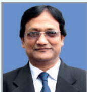
ငါးမိ တွဲ တွဲ ဝိာ် ငါးမိ ဝိာ်