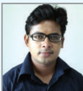
tqt Annmb Zuti K cfil K