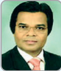
8. Rbve Gg. tnj vj