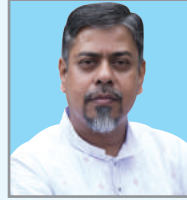
তগ্ৰত গক্চ ডি'খ ম্নত্হম্খ আ'ত্ক