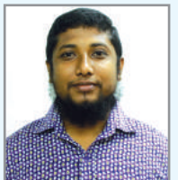
ত্গৰম্ব$ গম্য় ৱি ত্ফ ম্নক্ৰিখ আ'ত্ক