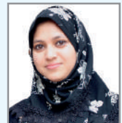
dvi` v Bqumgcb cfil K