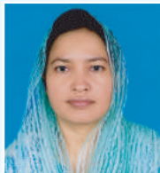
នាយករដ្ឋមន្ត្រី ក្រុមប្រឹក្សា