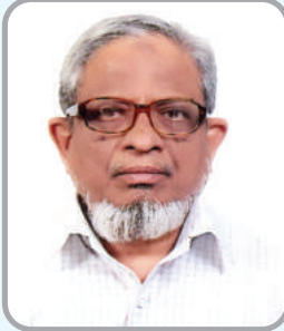
5. Rbve tgv kvqOj `v