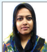
kwn` v kvi gnb cfil K