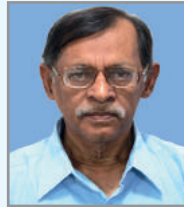
ငါးမိ တွဲ တွဲ ဝိာ် ငါးမိ (အာ် ဝိာ်)