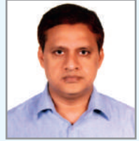
তগ্ৰত ত্গক্জিক অৱন্ত্গ` ম্নত্হম্খ আ'ত্ক