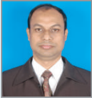
তগ্ৰত ত্জস্ন`জ ৰম্জ ৱ্গ ম্নত্হম্খ আ'ত্ক