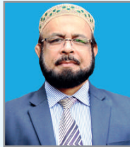
ငါးမိ တွဲ ကုာ် ဝိာ် ငါးမိ, ငါးမိ (ဝိာ် ငါးမိ)