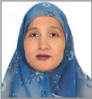
মৱৰুৰ্ৰ অইং` ম্নত্হম্খ আ'ত্ক