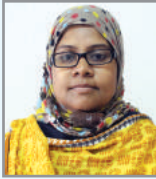
Zmugbv bwn` mnKrix Aa`cK