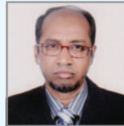
ငါးမိ တွဲ ဝိာ် ဝိာ် ငါးမိ ဝိာ်