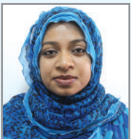
দৱি মব ৱনম্গজ ম্নক্ৰিখ আ'ত্ক