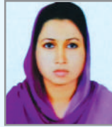
mwenv Avdmix cfil K