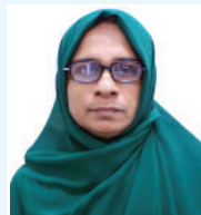
នាយករដ្ឋមន្ត្រី ក្រុមប្រឹក្សា