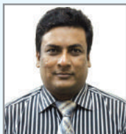
នាយករដ្ឋមន្ត្រី ក្រុមប្រឹក្សា