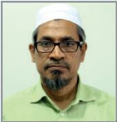
ငါးမိ တွဲ ဝိာ် ဝိာ် ငါးမိ ဝိာ်