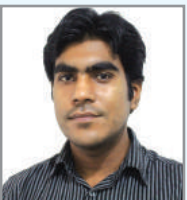
তগ্ৰত গুংগ্য় নম্ব ম্নক্ৰিখ আ'ত্ক