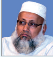
গম্ব$ অৱ্গব্জ ৰম্জ ৱ্গ ম্নত্হম্খ আ'ত্ক