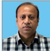
ငါးမိ တွဲ ဝိာ် ဝိာ် ငါးမိ ဝိာ်