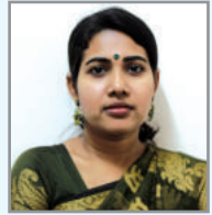
gy`3 िवq चिचि K