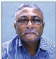
នាយករដ្ឋមន្ត្រី ក្រុមប្រឹក្សា