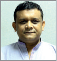
ত্গৰম্ব$ ত্গকুইড তন্ত্ৰম্ৰ ম্নত্হম্খ আ'ত্ক