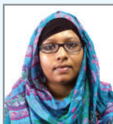
dvi nbv tdi`t` sn cfil K