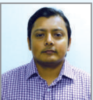
অৱনম্ৰ ডুই`ব লব চ'ফিলক