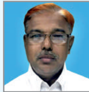
ငါးမိ တွဲ ဝိာ် ဝိာ် ငါးမိ ဝိာ်