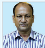
នាយករដ្ឋមន្ត្រី ក្រុមប្រឹក្សា