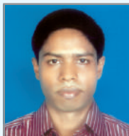
នាយករដ្ឋមន្ត្រី ក្រុមប្រឹក្សា