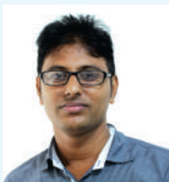
কৱ্গ্জ প`ত` েব্ চ'ফিলক