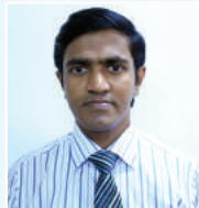
នាយករដ្ឋមន្ត្រី ក្រុមប្រឹក្សា