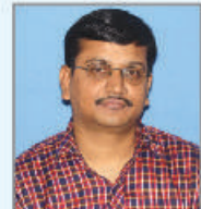
বিশ্বুপদ বণিক সহযোগী অধ্যাপক